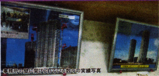
事務所の壁に架けられている数々の実績写真

江戸川区南小岩に社屋を構える株式会社耀雄(やくゆう)は、高工を主とする建設会社である。高工にもいくつかの種類があり、耀雄は会社設立以来、請け負った200件あまりにも及ぶ工事のうち、その約6割は高層ビル建設。主に工場のラインで製造された鉄筋コンクリート製の部材を現場で組み立て、躯体を作るPC(プレキャスト・コンクリート)工法を手